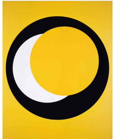
Geneviève Claisse, Cercles , 1969, Acrylique sur toile. Donation de l'artiste en 1982. Musée départemental Matisse, Le Cateau-Cambrésis. © ADAGP, Paris, 2015 Photo Florian Kleinfenn

Depuis ses débuts dans les années 1950 jusqu'à aujourd'hui, Geneviève Claisse a poursuivi de manière cohérente l'élaboration d'un langage non-figuratif, libéré de toute référence au monde matériel. Parmi les œuvres qui ont marqué sa production, on retrouve ses peintures développées uniquement à partir des formes élémentaires géométriques : cercle, triangle, carré, suivies bientôt de structures et de formes diagonales, insufflant un dynamisme et une profondeur au plan pictural avec les moyens des plus économiques.